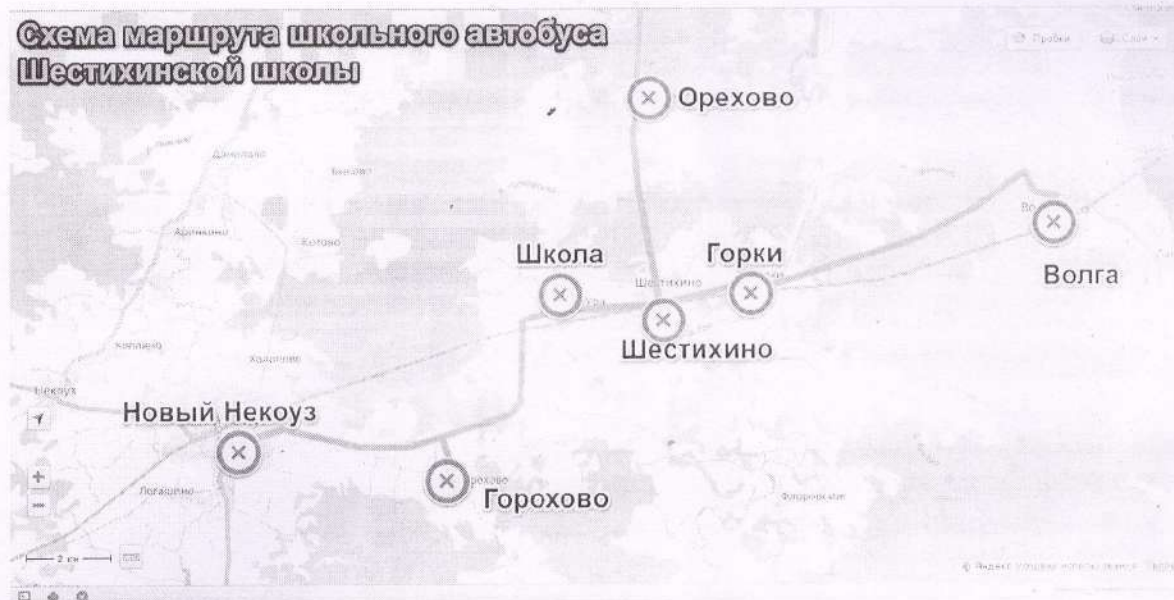
Схема маршрута школьного автобуса